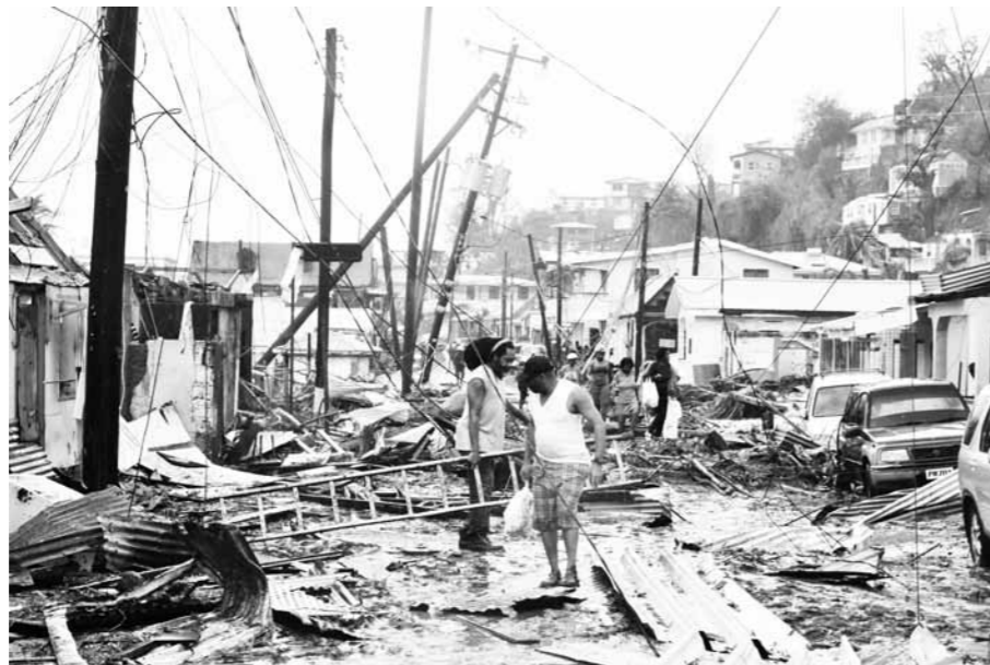
Roseau, die Hauptstadt der karibischen Inselrepublik Dominica am Morgen nach dem Monsterturm Maria, der a, 17.9.2017 mit über die Insel hinweggefegt ist