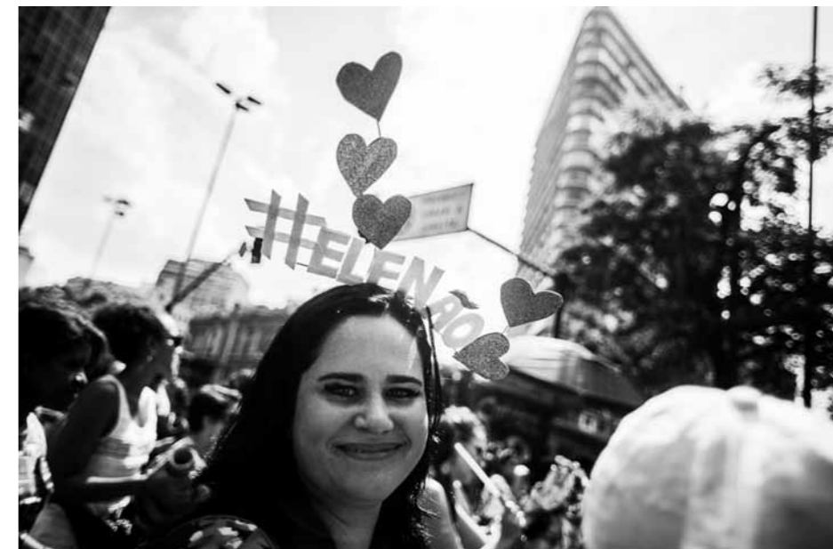
#elenão (pas lui): campagne lancée par les mouvements de femmes contre l'élection de Jair Bolsonaro

Cependant, la population qui bénéficie de plus de 5 mois de salaire minimum est minoritaire et ne pourrait à elle