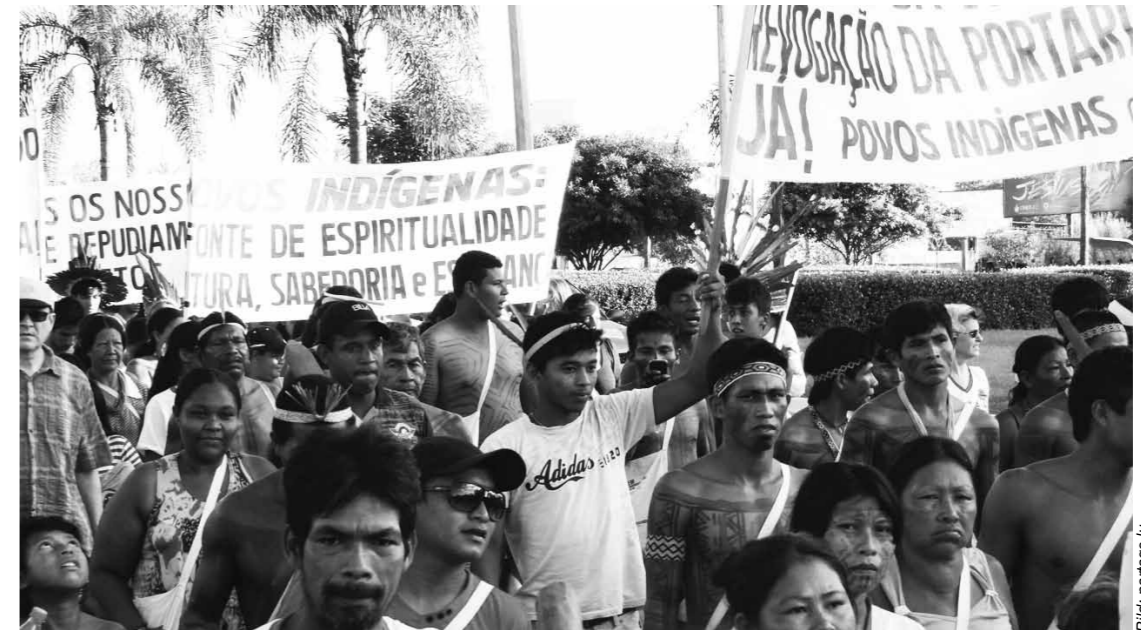
Indigene Völker kämpfen in ganz Brasilien um ihre Verfassungsrechte

Es ist schlicht und einfach empörend was sich der Präsidentschaftskandidat Bolsonaro an menschenverachtenden Aussagen gegen Indios, Frauen, Afrobrasilianer, Menschen mit anderen sexuellen Identitäten leistet. Dass eine Mehrheit der brasilianischen Wähler und Wählerinnen dies in Kauf nimmt ist zutiefst schockierend und verstörend.